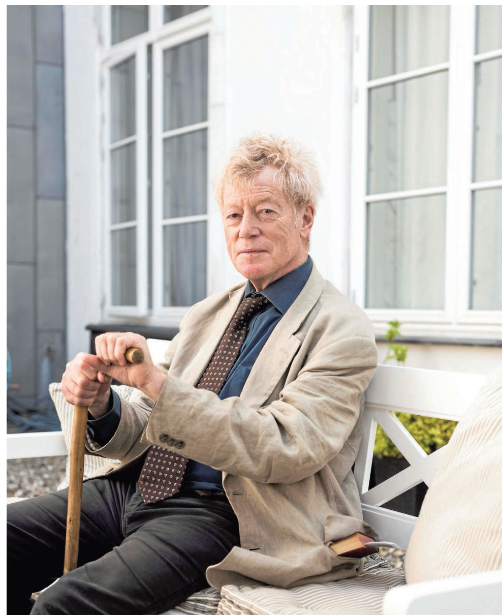
Roger Scruton får på hjemmesiden Goodreads begejstret omtale af sin bog.

"Scruton har valgt at se på 'Parsifal' gennem en numinos (guddommelig) magt set