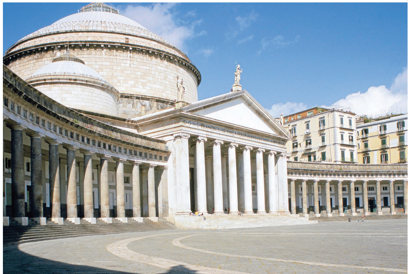
Napoli er ofte lidt stedmoderligt behandlet og har haft sin rigelige del af naturkatastrofer og anden modgang. Mest berømt er Vesuvius udbrud i år 79 e.Kr., der ødelagte de nærliggende byer Pompeji og Herculaneum. Alt dette fremgår af den nye bog, der primært handler om kirkerne og klosterne i Napoli, om tro og overtro, helgener og mirakler. Her ses Francesco di Paola-kirken, der blev bygget 1817-1846.

pel, som betyder den nye by, er grundlagt af grækerne omkring det 6. århundrede før Kristus. Gennem historien har både romerne, byzantinerne, normannerne og de spanske aragonere præget byen. Stadig kan sammenfaldet mellem kirke og adel spores i Napolis kunst og historie.